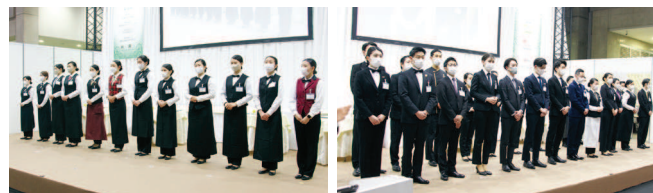
カレッジ部門出場選手 ヤングプロフェッショナル部門出場選手