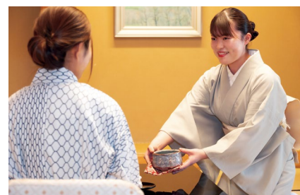
客室サービススタッフ

サービス部門の「部内及び部門別研修」では、旅館ならではの「和」のおもてなしや作法、前述しましたHRSの課題に沿った洗練された「洋」のサービススキル、テーブルマナー、日本料理食卓作法、飲料知識(ワイン・日本酒等)を有資格者及び責任者が年間を通して定期的に、和洋双方の知識習得及び技能向上を目的として実施しております。