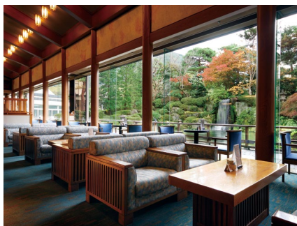
ロビーラウンジ&日本庭園

その他、館内にはロビーラウンジ、バー、室内温泉プール、アスレチックジム、エステサロン、ナイトクラブなど設備も充実しております。又、当館では日本の伝統文化を大切にしており日本庭園、本格的な能舞台、お茶室、画廊があり著名な作家の絵画や陶芸品・美術品の展示やお茶会等の催事も行っております。