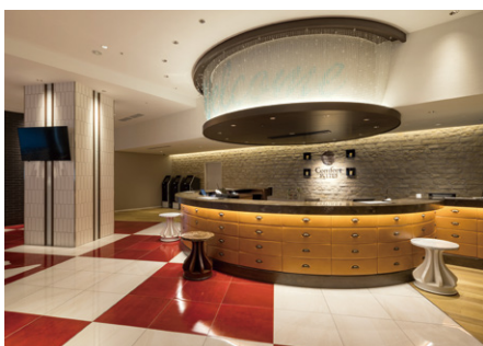
コンフォートスイーツ東京ベイ