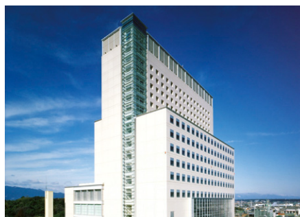
ホテルグリーンパーク津